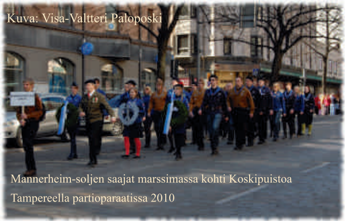
Mannerheim-soljen saajat marssimassa kohti Koskipuistoa Tampereella partioparaatissa 2010