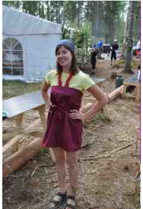
Jansku päivätehtävässään kyläkeittiössä

Tarpojat viettivät päivänsä ohjelmalaaksoissa ja savuissa. Leiri oli onnistunut ja hyvä kokemus ja sen innoittamana osa meistä vaeltajista lähteekin ensi kesänä maailman jamboreelle Ruotsiin!